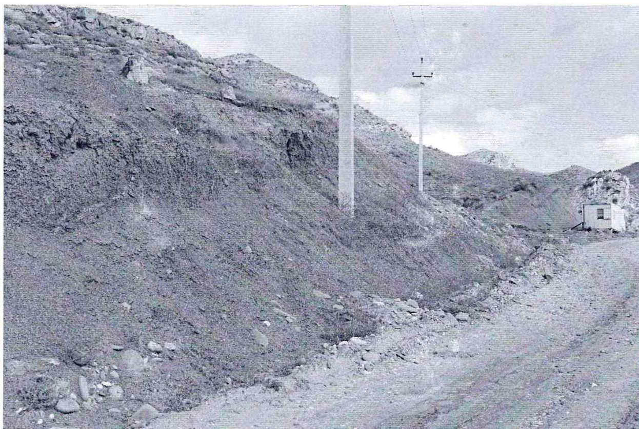
Фото №6 Песчаный карьер, на расстоянии 3 км к югу от села Гельбах ,с левой стороны от дороги Гельбах-Дубки, на территории объекта культурного наследия федерального значения, памятника археологии «Сигитминское 1-е поселение».