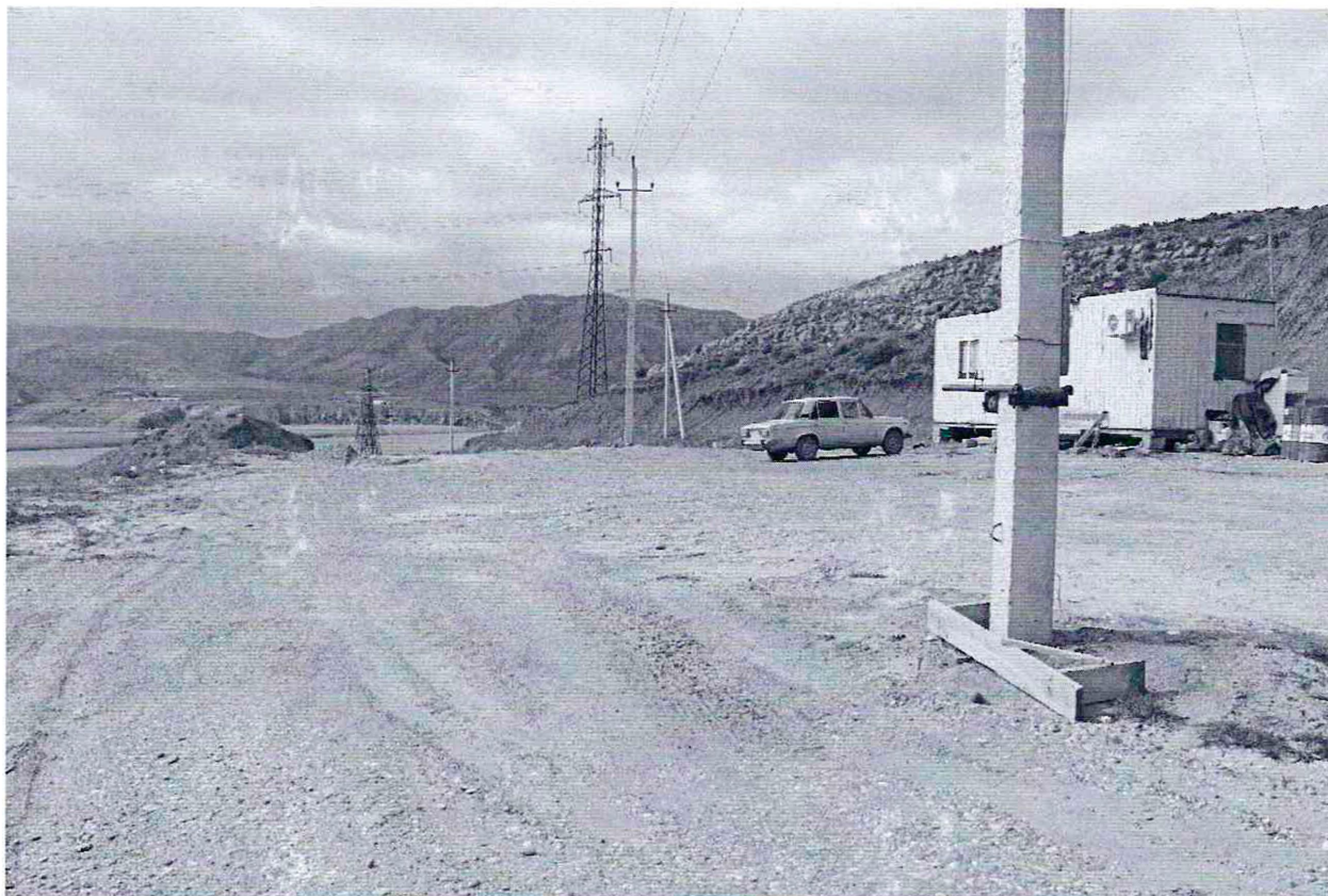
Фото №5 Песчаный карьер, на расстоянии 3 км к югу от села Гельбах ,с левой стороны от дороги Гельбах-Дубки, на территории объекта культурного наследия федерального значения, памятника археологии «Сигитминское 1-е поселение».