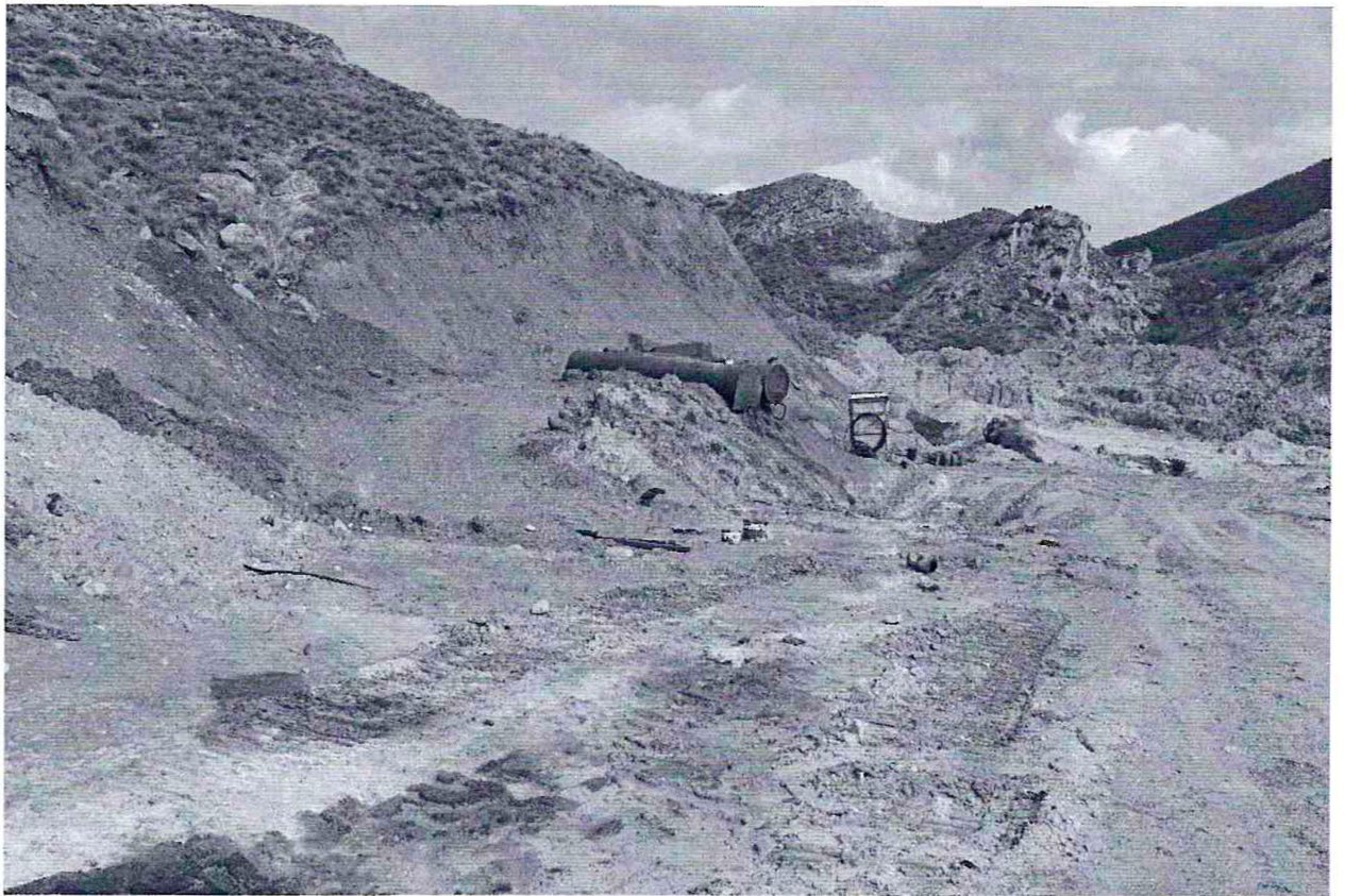
Фото №3. Песчаный карьер, на расстоянии 3 км к югу от села Гельбах ,с левой стороны от дороги Гельбах-Дубки, на территории объекта культурного наследия федерального значения, памятника археологии «Сигитминское 1-е поселение».