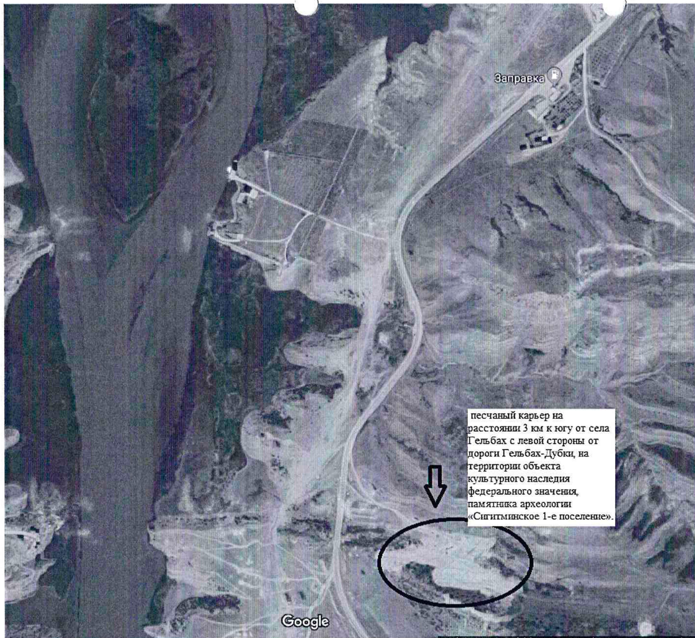
Карта-схема расположения песчаного карьера, на расстоянии 3 км к югу от села Гельбах, с левой стороны от дороги Гельбах-Дубки, на территории объекта культурного наследия федерального значения, памятника археологии «Сигитминское 1-е поселение».