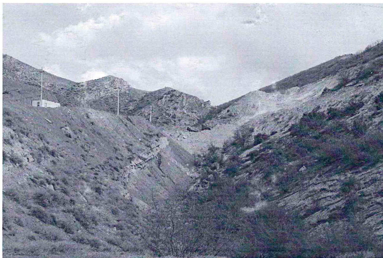
Фото №2 Песчаный карьер, на расстоянии 3 км к югу от села Гельбах , с левой стороны от дороги Гельбах-Дубки, на территории объекта культурного наследия федерального значения, памятника археологии «Сигитминское 1-е поселение».