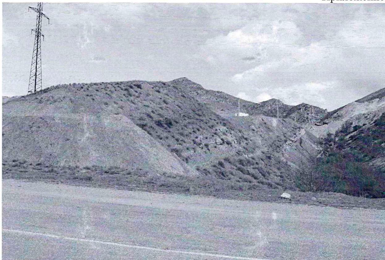
Фото №1. Песчаный карьер, на расстоянии 3 км к югу от села Гельбах , с левой стороны от дороги Гельбах-Дубки, на территории объекта культурного наследия федерального значения, памятника археологии «Сигитминское 1-е поселение».