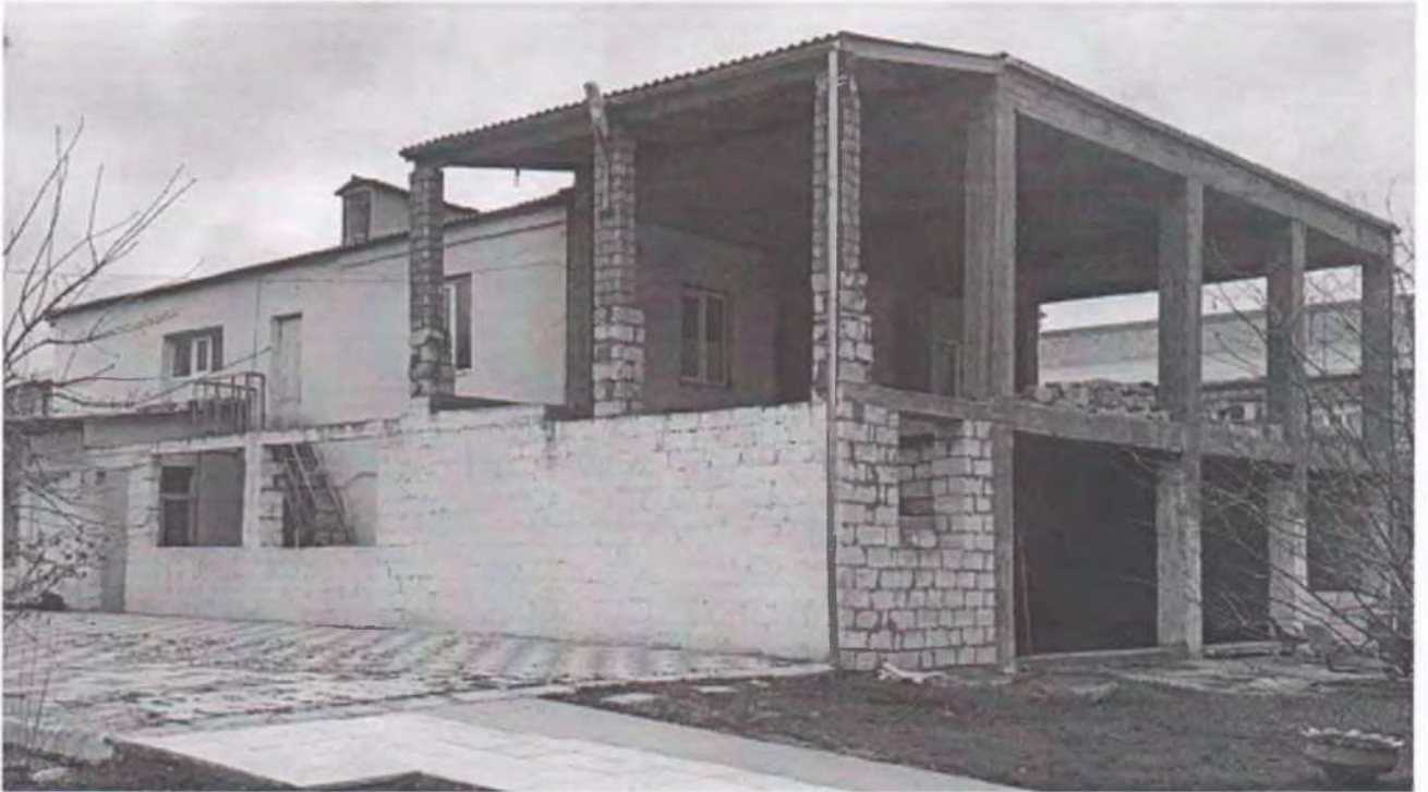
Фото №2 Объект незавершенного строительства, предположительно по адресу: г. Дербент, ул.Гагарина, д.2.