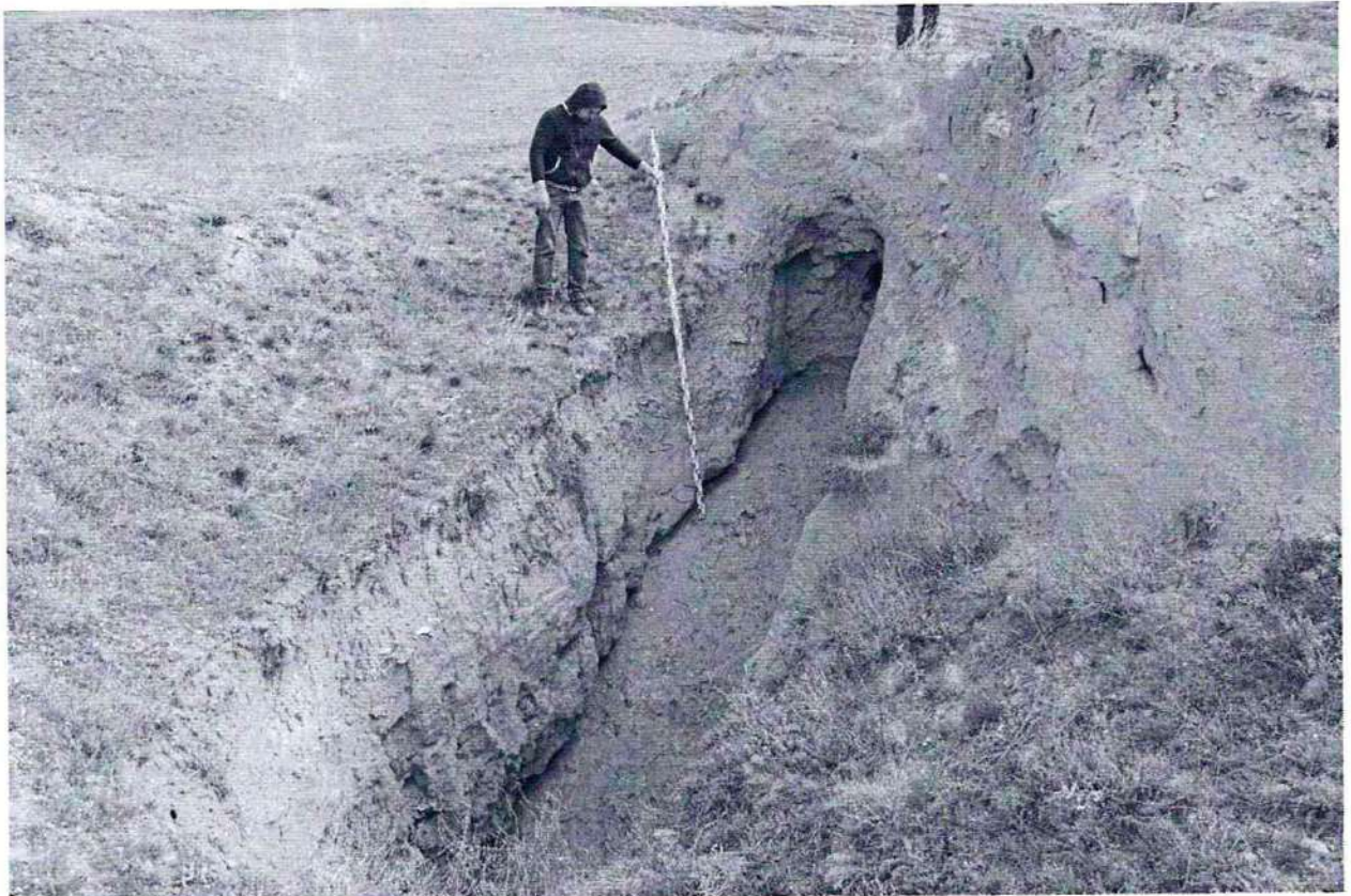
Фото №8. Грабительский шурф на территории объекта культурного наследия федерального значения, памятника археологии «Верхнечирютовский курганный могильник».