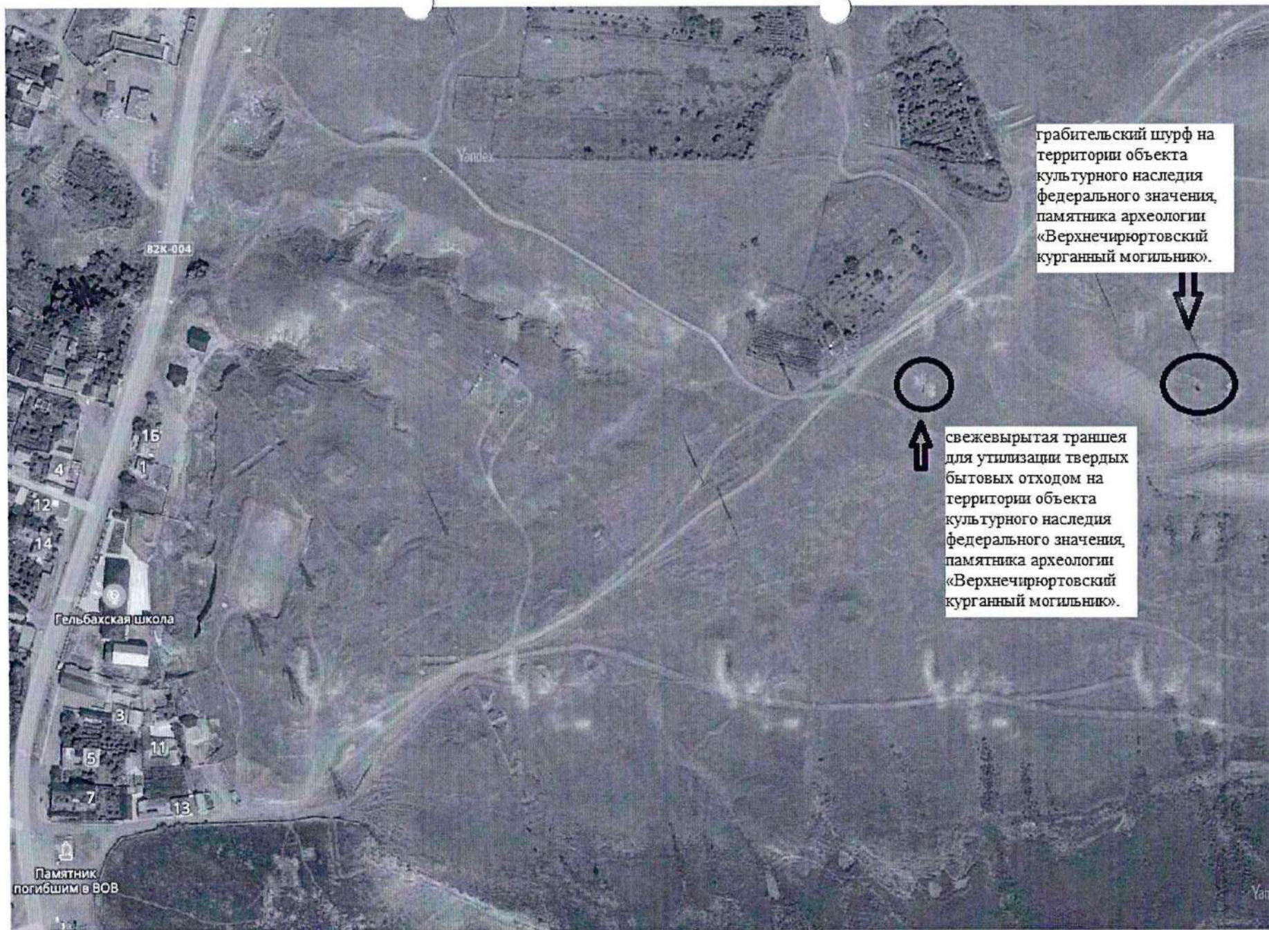
Карта-схема расположения траншеи для утилизации твердых бытовых отходов и грабительского шурфа на территории объекта культурного наследия федерального значения, памятника археологии «Верхнечирюртовский курганный могильник».