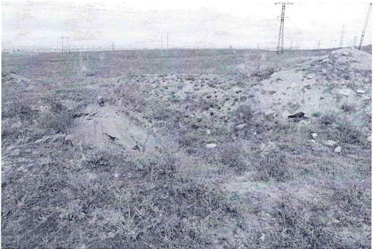
Фото №4. Траншея для утилизации твердых бытовых отходов на территории объекта культурного наследия федерального значения, памятника археологии «Верхнечирюртовский курганный могильник».