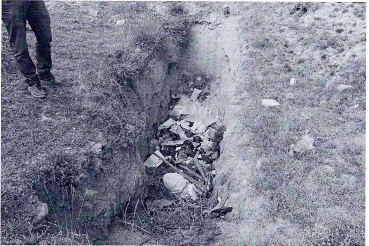
Фото №3. Траншея для утилизации твердых бытовых отходов на территории объекта культурного наследия федерального значения, памятника археологии «Верхнечирюртовский курганный могильник».