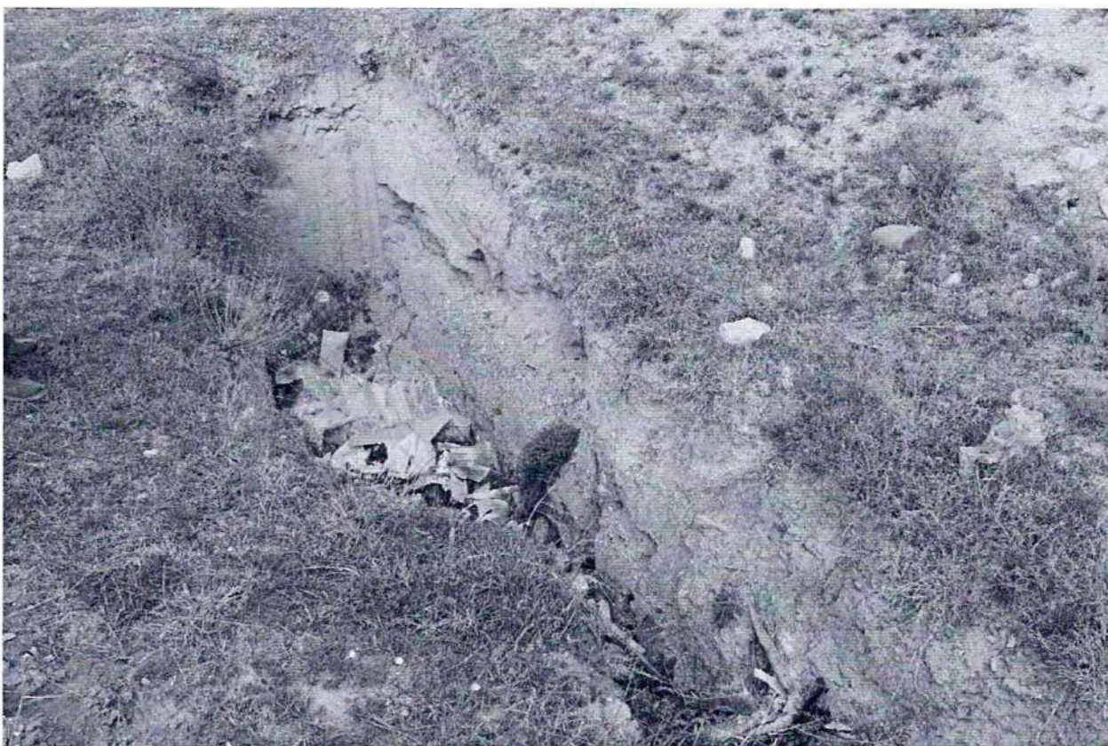
Фото №2. Траншея для утилизации твердых бытовых отходом на территории объекта культурного наследия федерального значения, памятника археологии «Верхнечирюртовский курганный могильник».