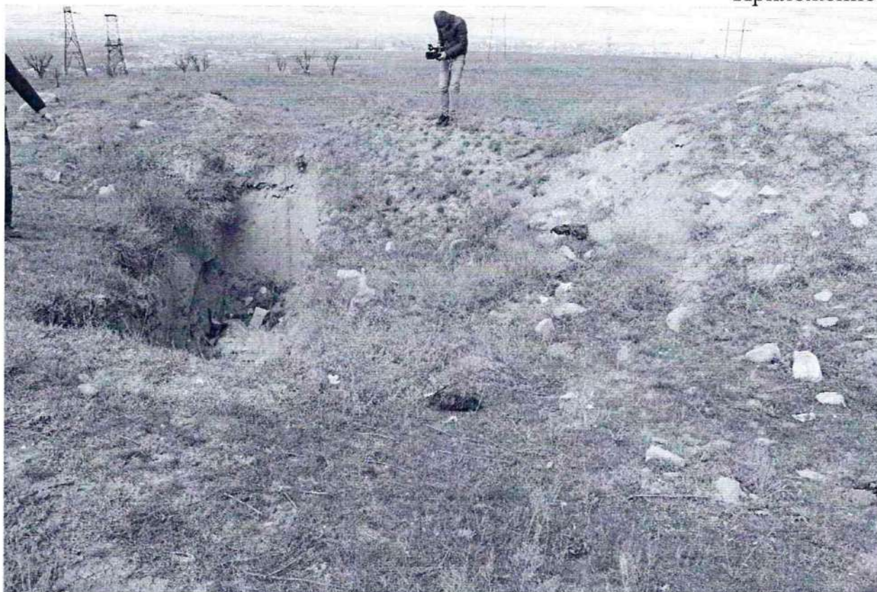
Фото №1. Траншея для утилизации твердых бытовых отходом на территории объекта культурного наследия федерального значения, памятника археологии «Верхнечирюртовский курганный могильник».