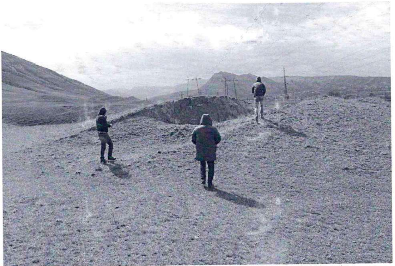
Фото №5. Грабительский шурф на территории объекта культурного наследия федерального значения, памятника археологии «Верхнечирюртовский курганный могильник».