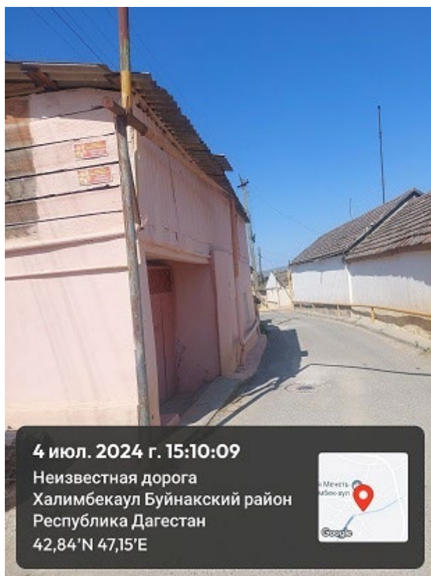
Фото 3. Вид на объект культурного наследия «Дом Эльдаровых», конец XIX в.