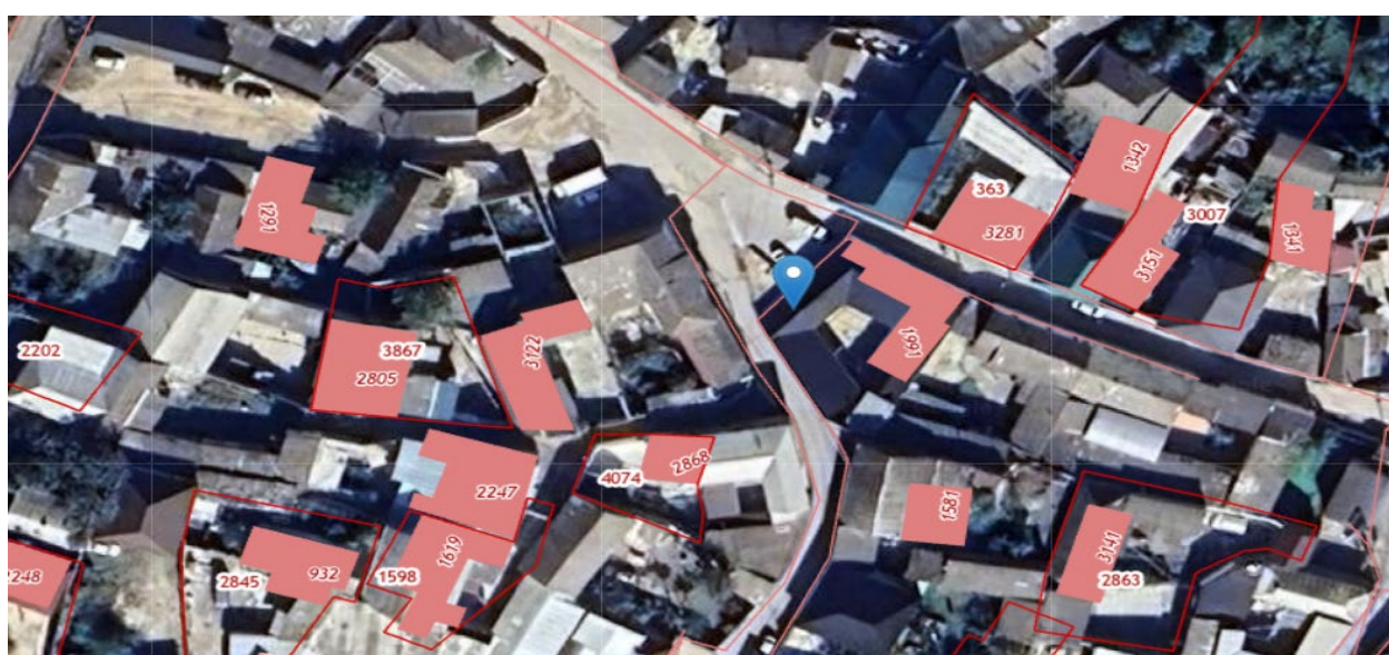
Рис 2. Вид на объект культурного наследия в структуре населенного пункта