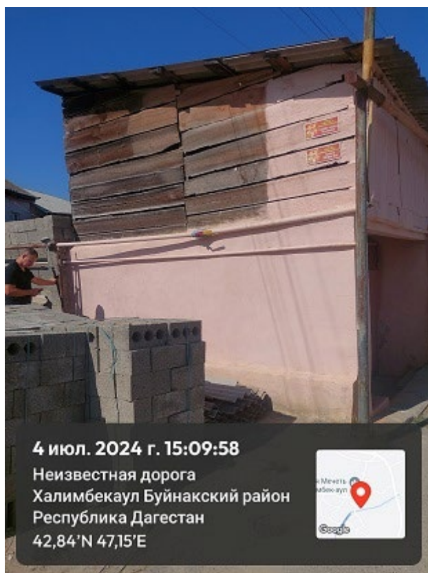
Фото 4. Вид на объект культурного наследия «Дом Эльдаровых», конец XIX в.