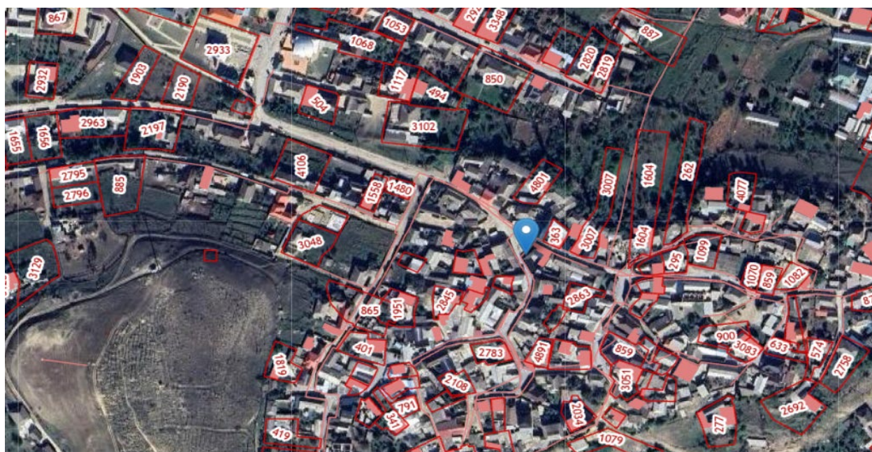
Рис 1. Вид на объект культурного наследия в структуре населенного пункта