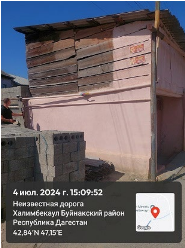
Фото 1. Вид на объект культурного наследия «Дом Эльдаровых», конец XIX в.